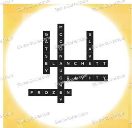
2014 Oscar Winners

Benza Answers - Daily Puzzles From 2014 March 2014 : 3 2014 Oscar Winners Language: English by http://game-solver.com/ created: 2014-09-10