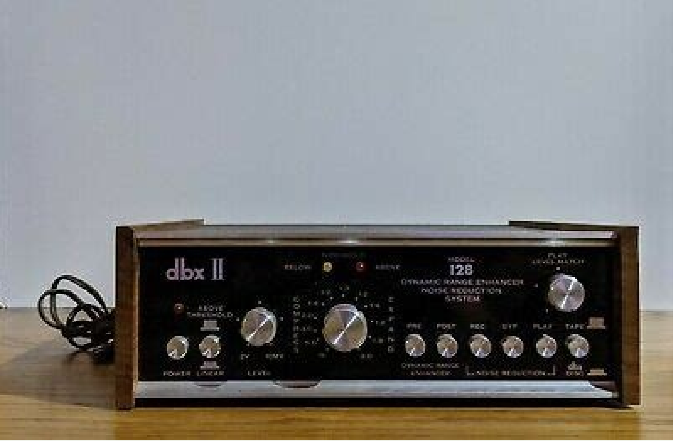
Dbx ii model 128. Dbx 128 manual.